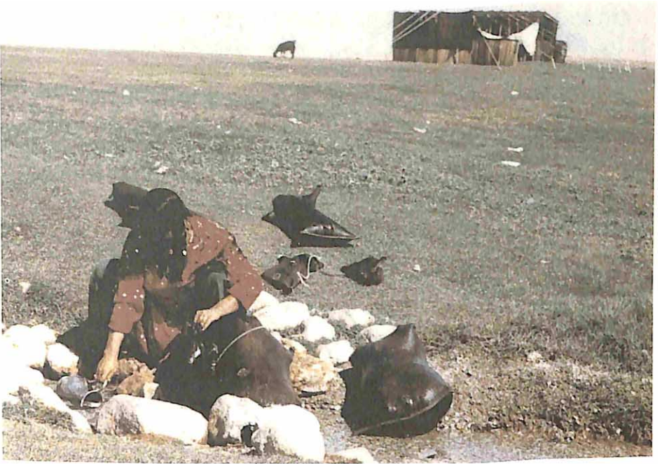
Meşk'e gözeden su dolduran bir genç